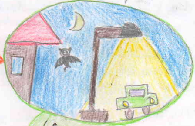
✓ SPRÁVNĚ ✓