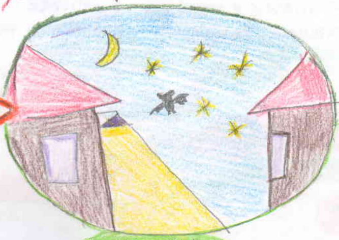
✓ SPRÁVNĚ ✓