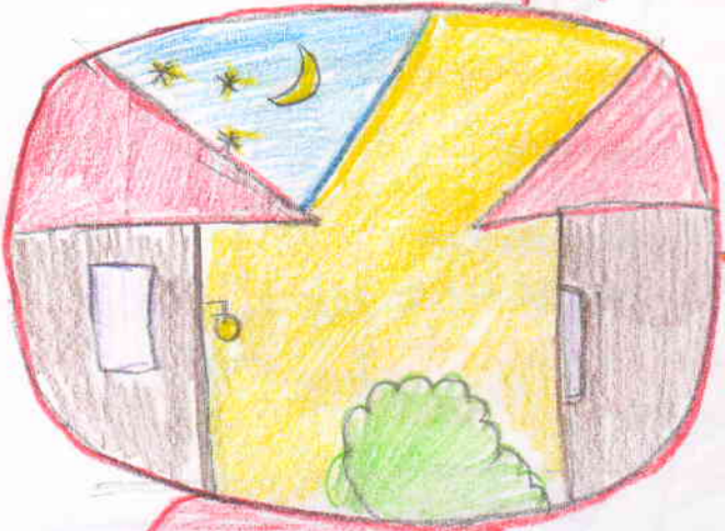
X ŠPATNĚ X

= hlavní polutant = špatně orientované, silné a bytelné osvětlení